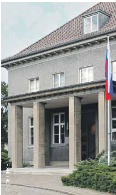
DIE LINKE setzt sich für eine Aufnahme des Deutsch-Russischen Museums in Karlshorst in die Gedenkstättenliste ein.

Die alljährlichen Demonstrationen der rechten Geschichtsrevisionisten in Sicht- und Hörweite des Museum würden damit endlich der Vergangenheit angehören. Ein entsprechender