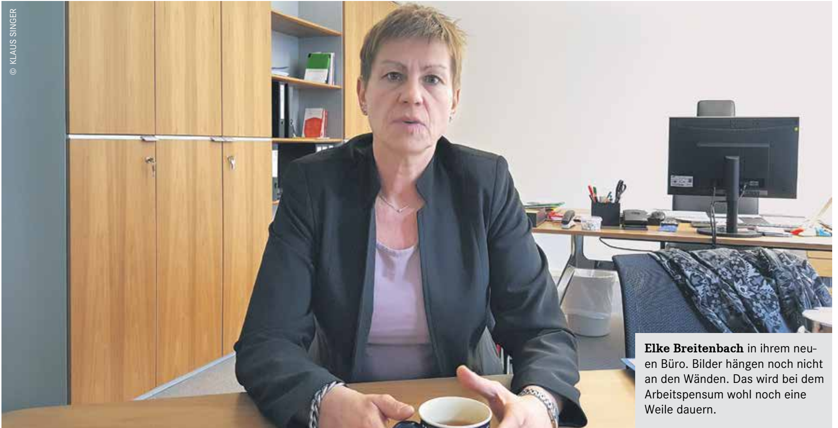
Elke Breitenbach in ihrem neuen Büro. Bilder hängen noch nicht an den Wänden. Das wird bei dem Arbeitspensum wohl noch eine Weile dauern.