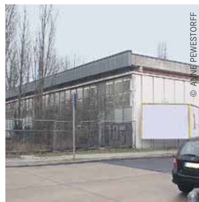
Die Lichtenberger Turnhalle in der Wollenberger Straße 1 konnte freigezogen werden.

Arme Kinder haben arme Eltern. Wir müssen also Eltern in Arbeit bringen. Alleinerziehende haben es besonders schwer auf dem Arbeitsmarkt. Sie brauchen einen Kindergartenplatz. Wir haben die Bedarfsprüfung abgeschafft. Wir wollen Senioren besser über ihre Rechte informieren und sie ermutigen,