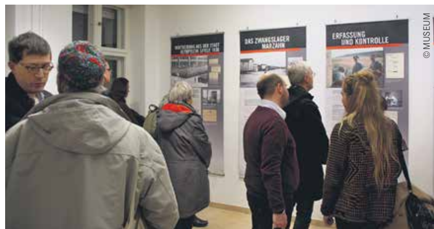
Die Ausstellung „Die nationalsozialistische Verfolgung der Sinti und Roma in Berlin“ ist bis zum 12. Februar im Museum Lichtenberg zu sehen.