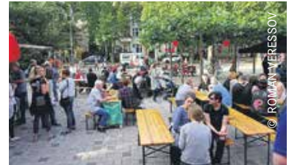
Beim Red-Star-Fest im Sommer 2016 war der Johannes-Fest-Platz in Karlshorst gut besucht.