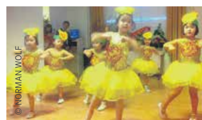
Die Kindertanzgruppe eröffnete den kulturellen Teil des Tet-Fests.

Den vietnamesischen Vertragsarbeitern der DDR wurde erst 1997 ein langfristiges Bleiberecht zubilligt. U. a. setzte sich die PDS für den dauerhaften Aufenthalt der VietnamesInnen ein. Und so konnte deren Integration richtig beginnen. Nun hatten sie eine Perspektive. In der KULTSchule sorgt die Vereinigung der Vietnamesen zusammen mit dem Verein Lyra e.V. für ein internationales Flair in Lichtenberg. Dazu gehört auch das Feiern des Tet-Fests, mit dem am 2. Februar das neue Jahr eingeleitet wurde. Und so taucht man in eine Welt ein, die einerseits weit weg ist, aber gleichzeitig doch so nah.