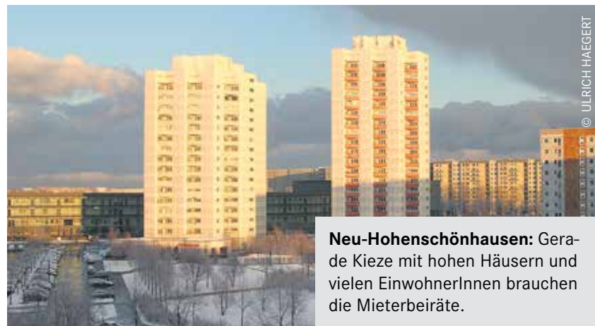
Neu-Hohenschönhausen: Gerade Kieze mit hohen Häusern und vielen EinwohnerInnen brauchen die Mieterbeiräte.

Noch 2011 gab es bei der HOWOGE berlinweit sechs Mieterbeiräte, davon zwei in Hohenschönhausen: Warnitzer Bogen und Ostseevierviertel. Beide sind inzwischen eingeschlafen, insgesamt sind lediglich drei Mieterbeiräte bei der HOWOGE übrig: Frankfurter Allee Süd, Berlin-Buch, und Anton-Saefkow-Platz. Die Mieterbeiräte sind nicht zu verwechseln mit den 2016 eingeführten Mieterräten, denn obwohl beide die Mieterinteressen vertreten, miteinander kooperieren und eine ähnliche Bezeichnung tragen, sind sie doch verschieden. Die Mieterräte arbeiten quartiersübergreifend und sind in die „großen“ Unternehmensplanun-