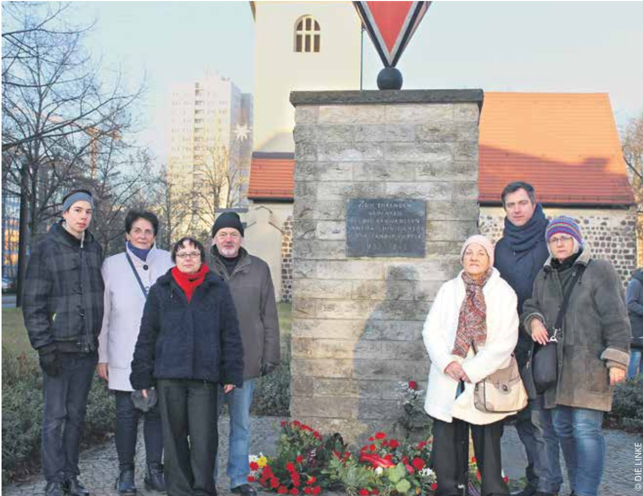
Die Fraktion der Lichtenberger LINKEN gedachte am 27. Januar auf dem Loeperplatz dem 72. Jahrestag der Befreiung des KZ Auschwitz und der Opfer des Faschismus.